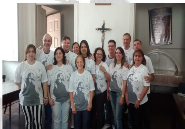
NOVOS TERCEIROS FRANCISCANOS

Que o coração deve pronunciar? Eu ser humano se atreve a cantar com a voz O canto de Deus?”.